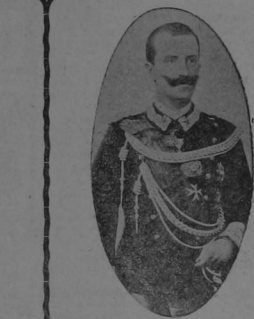
El Rey de Italia Victor Manuel III

En el aniversario glorioso de hoy, aniversario de aquella fecha inolvidable que selló con una victoria definitiva, la unidad de la Patria Italiana, nos complacemos en saludar a la colonia residente en este país, que ha sabido siempre manifestar laboriosa y activa, poniendo notables esfuerzos al servicio del progreso nacional.