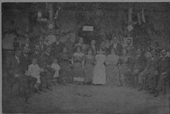
Fotografía tomada en la escuela de aquella simpática y progresista ciudad, de los profesores, autoridades y principales vecinos, que asistieron a la fiesta con que los escolares de aquella población celebraron el día de la Patria.