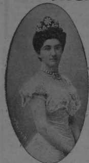
La Reina Elena